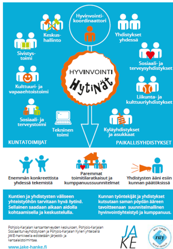
Kuva 3. Kunta-järjestö hyvinvointiyhteistyön toimintarakente