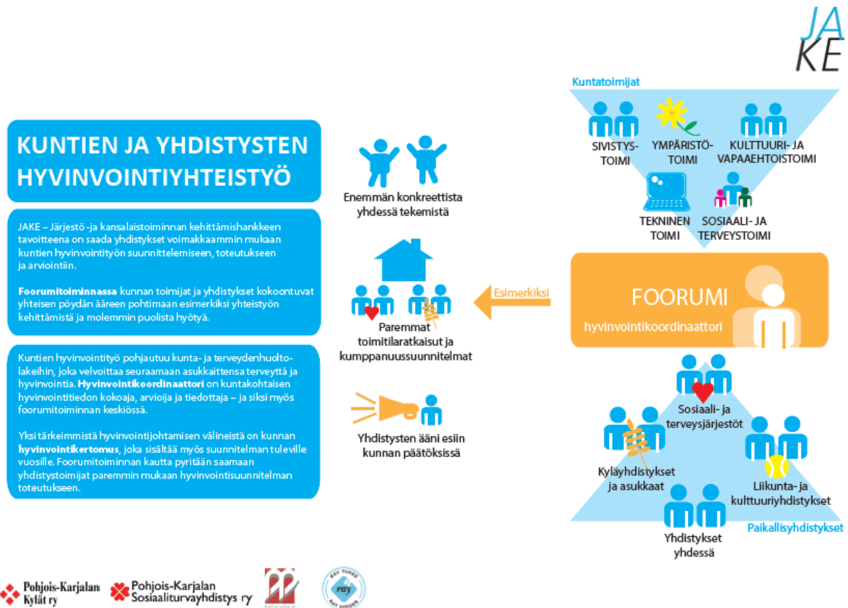
Kuva 3. Kunta-järjestö hyvinvointiyhteistyön toimintarakenne